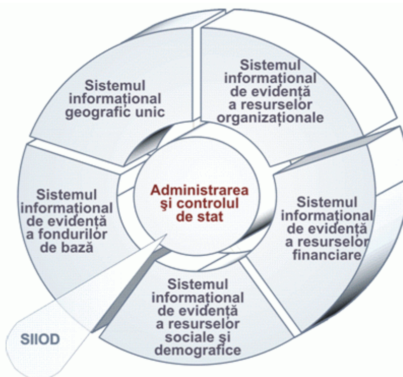
Figura 1. Locul SIIOD în sistemul de formare a resurselor informaționale de stat

Resursa informațională a organelor de drept reprezintă o totalitate sistematizată de date despre evenimentele care au loc în sfera de ocrotire a normelor de drept. Resursa respectivă este parte integrantă a Resurselor informaționale de stat ale Republicii Moldova, și anume, ale segmentului "Administrarea și controlul de stat" (figura 1).