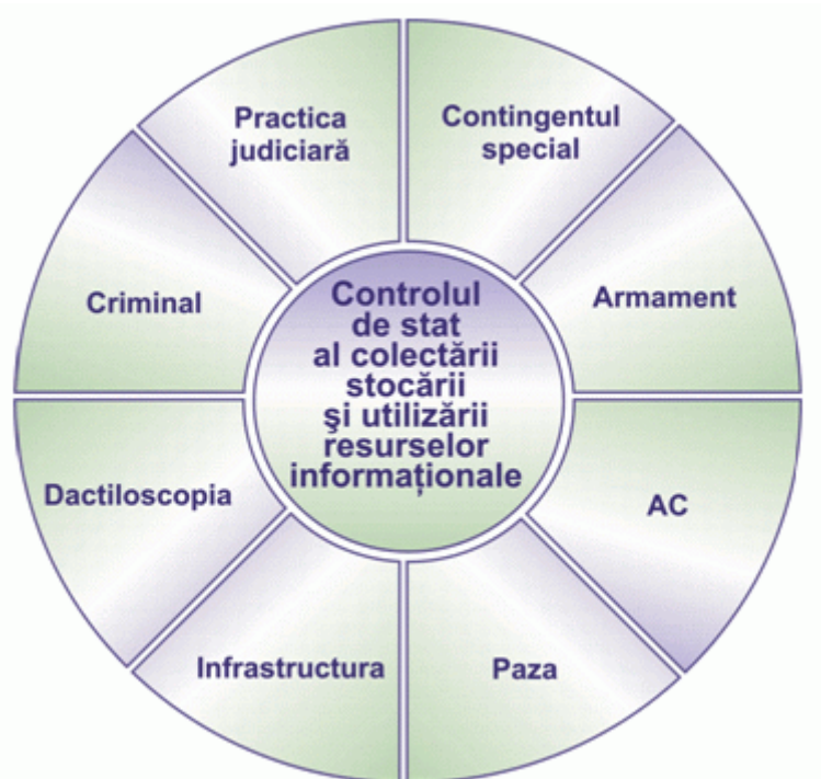
Figura 2. Blocurile funcționale ale sistemului

A. Blocul controlului de stat al resurselor informaționale include următoarele funcții: